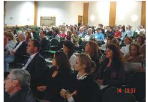
A edição de Passo Fundo foi bastante concorrida

Fica aqui o convite a todos os pediatras para a próxima Jornada, que em 2008 será realizada em Caxias do Sul.